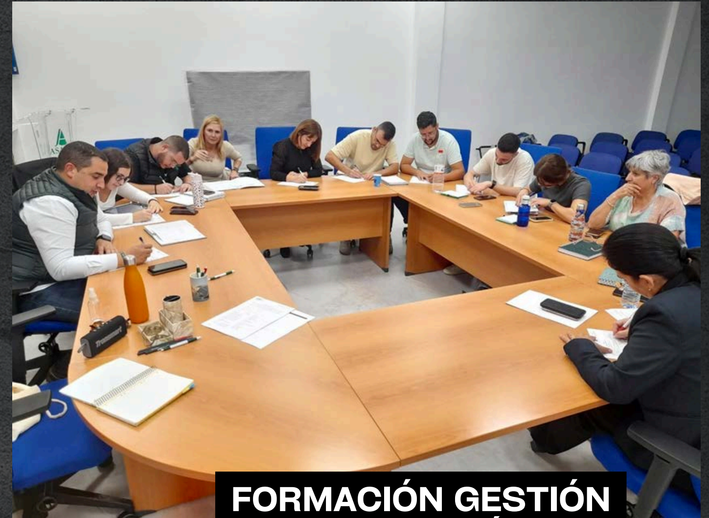
FORMACIÓN GESTIÓN DEL ESTRÉS