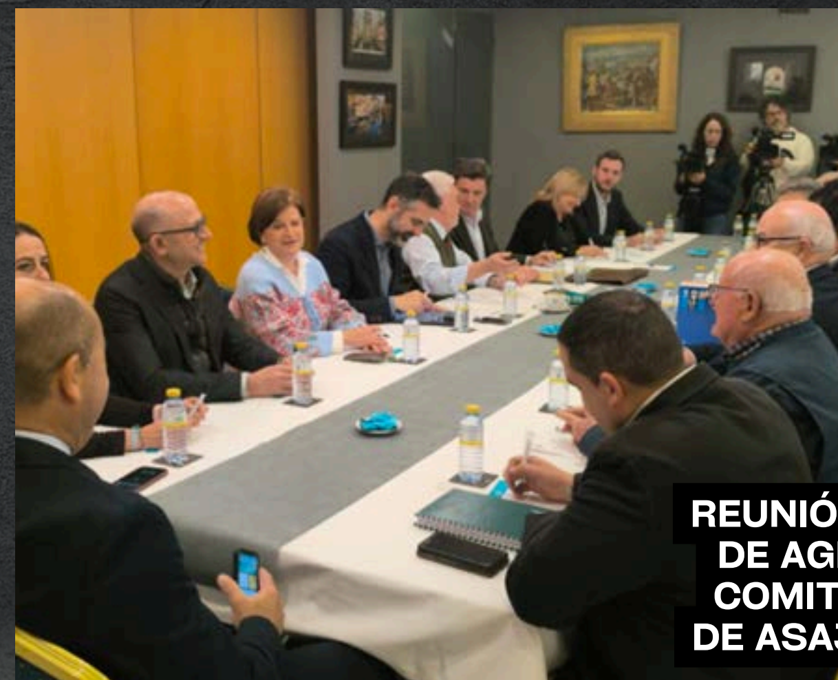
REUNIÓN CONSEJERO DE AGRICULTURA Y COMITÉ EJECUTIVO DE ASAJA ANDALUCÍA