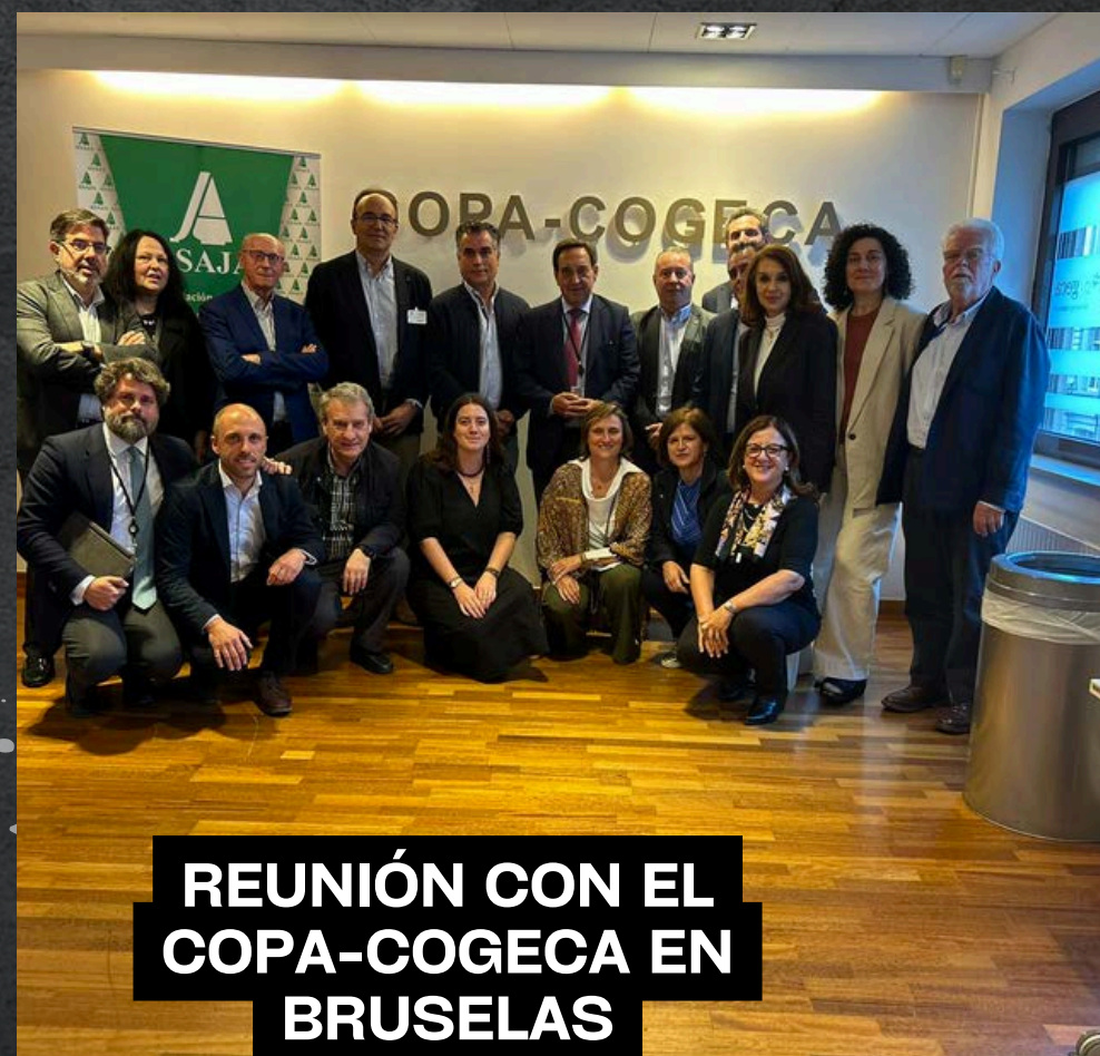
REUNIÓN CON EL COPA-COGECA EN BRUSELAS

»»» En 2025 suman 48 reuniones de este tipo