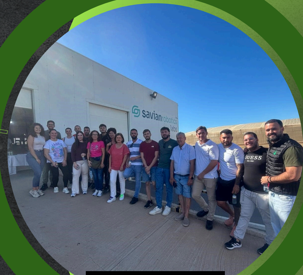
VISITA SAVIAN ROBOTICS

La sectorial de jóvenes de ASAJA organiza actividades formativas y de divulgación destinadas a todos los miembros, que son los asociados de menos de 40 años.