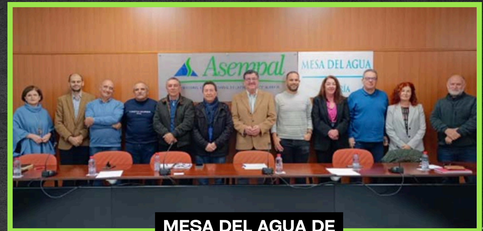
MESA DEL AGUA DE ALMERÍA