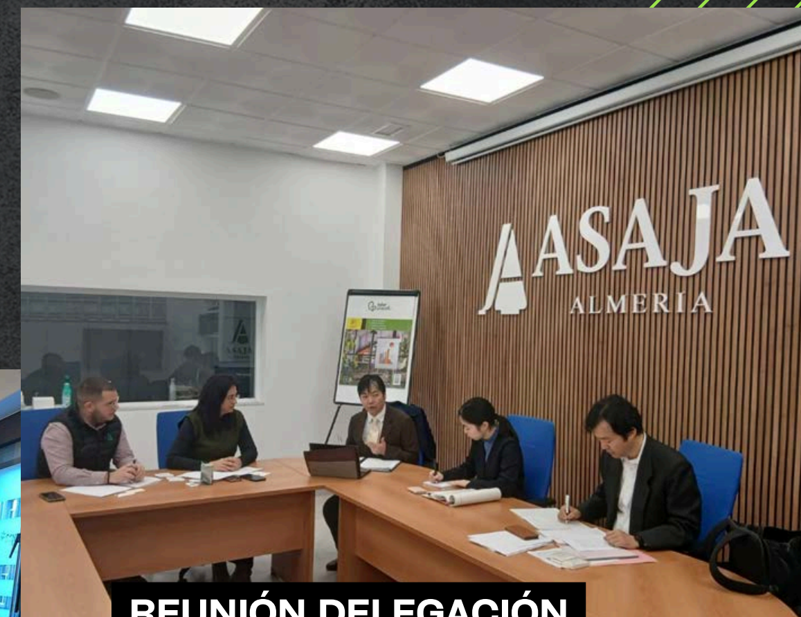
REUNIÓN DELEGACIÓN JAPONESA