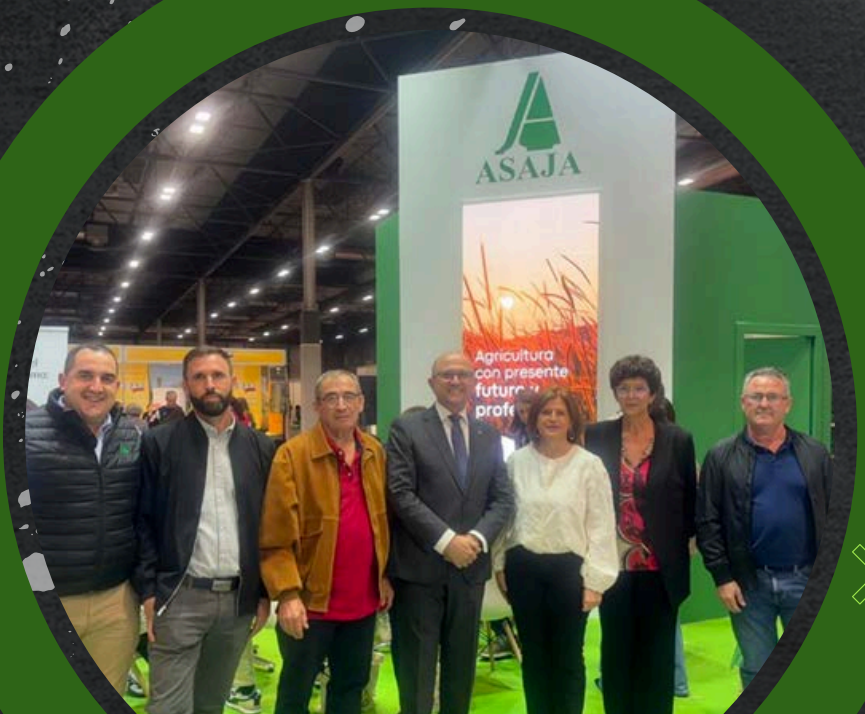
CONGRESO JÓVENES AGRICULTORES EN EXPOSAGRIS

La sectorial participa en el Congreso Nacional de Jóvenes Agricultores de ASAJA que lleva a cabo todos los años el “Premio Joven Agricultor”.