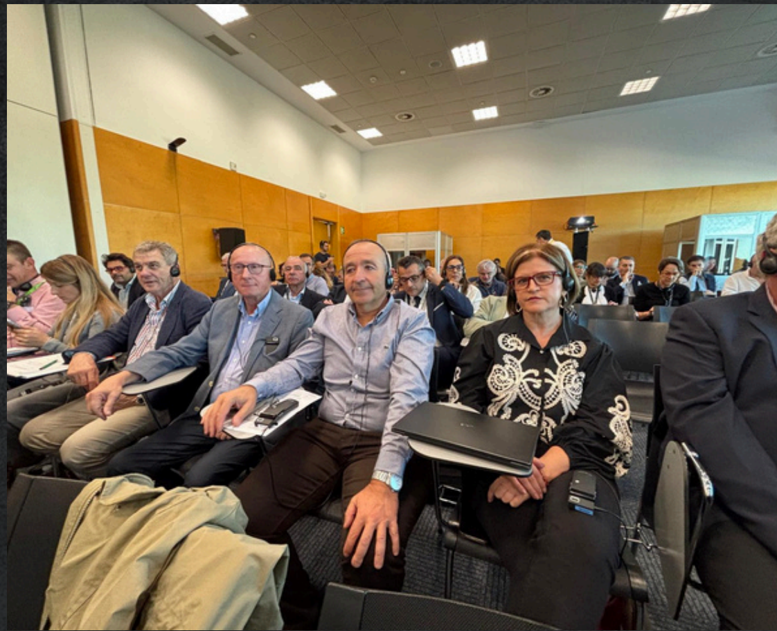
COMITÉ MIXTO FR-ESP- IT DE FRUTAS Y HORTALIZAS