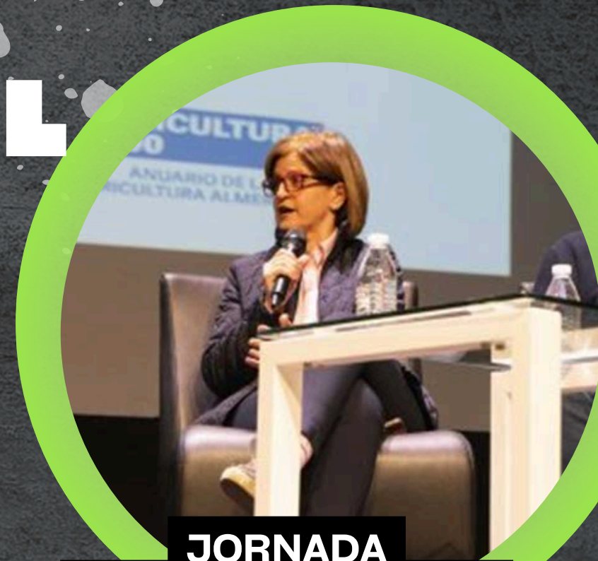
JORNADA AGRICULTURA 2000

EN 2025 se han hecho ponencias en 7 eventos organizados por terceros