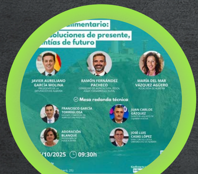
FORO TRIBUNA DE ANDALUCIA