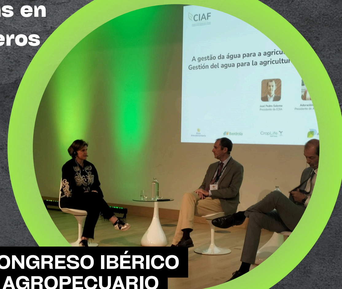
CONGRESO IBÉRICO AGROPECUARIO