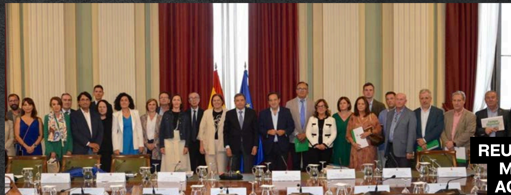
REUNIÓN ASAJA Y MINISTRO DE AGRICULTURA

»»» En 2025 se ha participado en 59 actos de este tipo