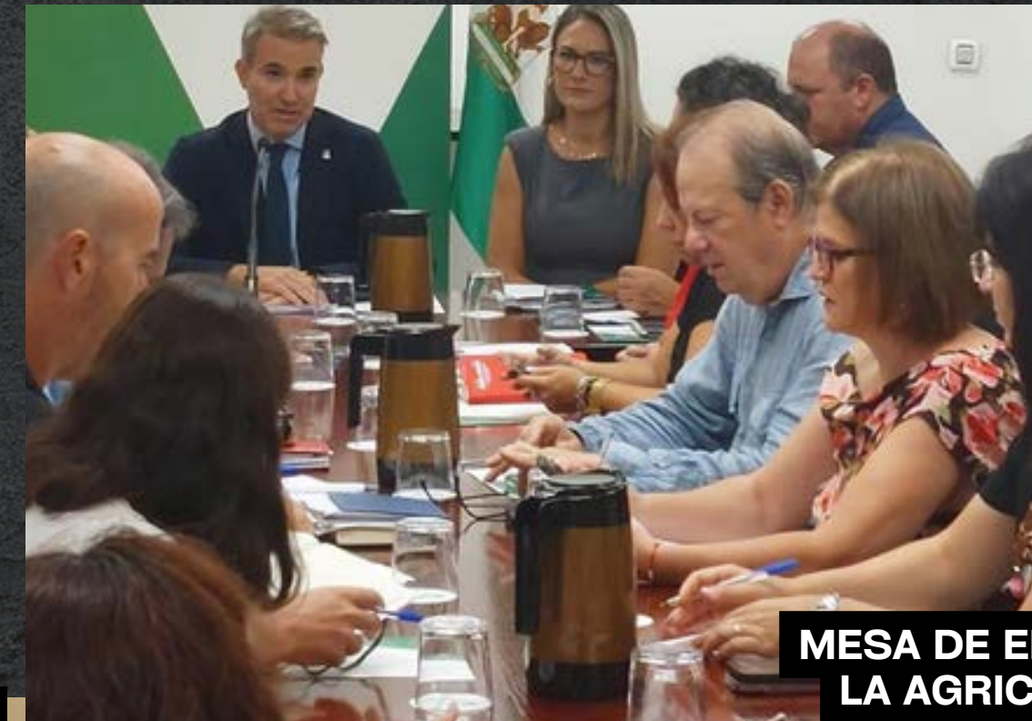
MESA DE EMPLEO DE LA AGRICULTURA