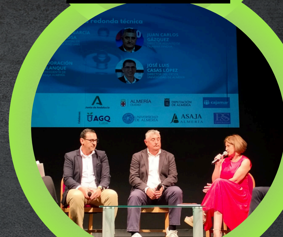
FORO TRIBUNA DE ANDALUCIA